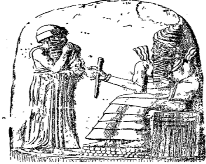
شكل (٦) الملك حمورابي أمام الإله شامش -